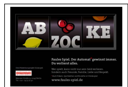
Info-Card der Kampagne für Jugendliche