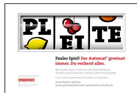
Info-Card der Kampagne für Eltern

Montag: 10.00-15.00 Uhr Dienstag: 13.00-18.00 Uhr Donnerstag: 09.00-13.00 Uhr