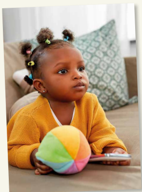
SMARTPHONE ODER BALL?

In der Regel geht damit eine fehlende elterliche Aufmerksamkeit für das Kind in der konkreten Situation einher. So gilt es auch beim Umgang mit digitalen Medien, sich der eigenen Vorbildrolle bewusst zu sein, d.h. den Fokus vom Handy wegzulenken und in die Interaktion mit dem Kind bzw. dem sozialen Umfeld zu treten. Darüber hinaus sollte der Umgang des Kindes mit digitalen Medien von den Erziehenden reflektiert werden, um kompetent zu entscheiden, welche Form der Mediennutzung für welches Alter angemessen ist.