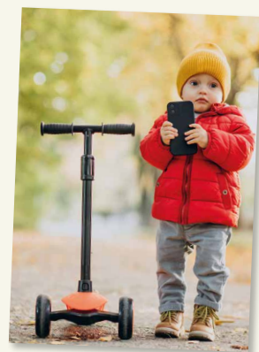
SMARTPHONE UNTERWEGS IN DER TASCHEN

Je stärker das Kind in der Lage ist, abstrakt zu denken, desto besser wird diese Fähigkeit mithilfe von Computerspielen vertieft und verfeinert.