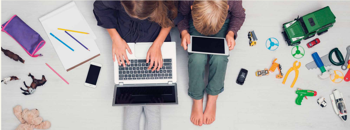
BILDSCHIRMMEDIEN VERDRÄNGEN OFT SPIELSACHEN