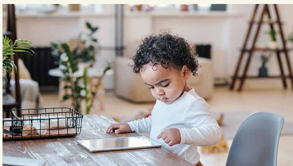
KINDER SIND OFT NEUGIERIG AUF SMARTPHONES ODER TABLETS