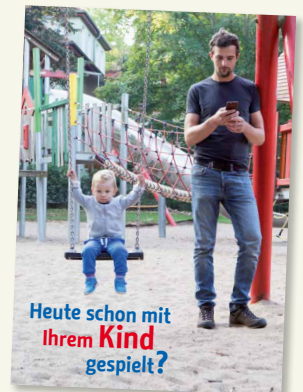
DIE KAMPAGNE „HEUTE SCHON MIT IHREM KIND GESPROCHEN?“

Eltern, die auf dem Spielplatz mehr aufs Handy als auf die Kinder schauen oder auch beim gemeinsamen Essen mit ihrem Smartphone beschäftigt sind, verpassen etwas und vermitteln ihrem Kind, dass es aktuell Priorität hat, ihre Aufmerksamkeit in die digitalen Medien zu investieren. Wie ich meinen Alltag gestalte, womit ich meine Zeit verbringe und welche Dinge für mich Vorrang haben, sind Aspekte, die Kinder aufnehmen und ins eigene Verhalten übernehmen können.