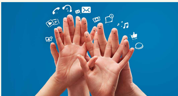
DIGITALE MEDIEN – WICHTIGE BILDUNGSCHANCE?

In der frühen Phase des Spracherwerbs scheint erhöhter Fernsehkonsum und das damit einhergehende reduzierte Sprechen innerhalb der Familie wiederum als hinderlich. 10 Ein hohes Maß an Fernsehkonsum in der frühen Kindheit erhöht die Wahrscheinlichkeit für Aufmerksamkeitsstörungen im 7. Lebensjahr. 11 Andere Befunde weisen darauf hin, dass Wissensprogramme wie z. B. die Sesamstraße bei Kindern zwischen 3 und 5 Jahren durchaus positive, bei jüngeren Kindern jedoch negative Effekte zeigen. 12 Entscheidend sind demnach nicht nur das Alter des Kindes, sondern auch die Qualität und der pädagogische Anteil der digitalen Angebote.