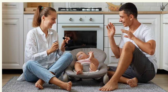
ANALOGE BESCHÄFTIGUNG IST WICHTIG