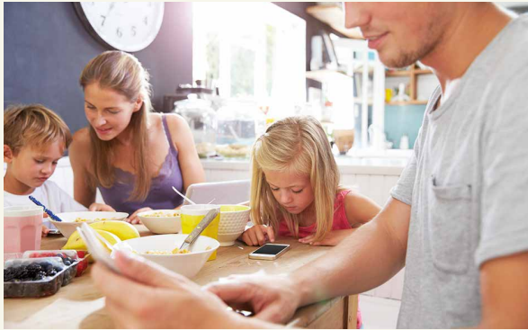
MEDIEN AM ESSTISCH