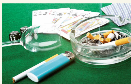
KEINE GUTE KOMBINATION – ALKOHOL, ZIGARETTEN UND

Das Berliner Landesprogramm für Verhaltenssuchte ist ein Netzwerk verschiedener Akteur*innen aus Prävention, Hilfe, Selbsthilfe und Verwaltung zu allen Verhaltenssuchten. www.landesprogramm-verhaltenssuchte.berlin