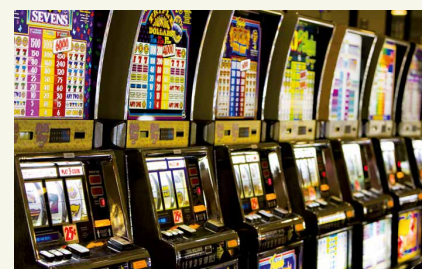
DER AUTOMAT GEWINNT IMMER

Ja! Jedoch: Für die meisten Menschen ist Spielen eine Freizeitaktivität, die mit Anregung, Spaß, Geselligkeit, Entspannung und Wohlbefinden verbunden wird. Spielen ist ein menschliches Bedürfnis. Viele können Glücksspiele problemlos in ihren Alltag integrieren, einige Menschen jedoch entwickeln ein riskantes oder süchtiges Spielverhalten, das gravierende negative Konsequenzen für ihre finanzielle Situation, Familie und Beruf nach sich ziehen kann.