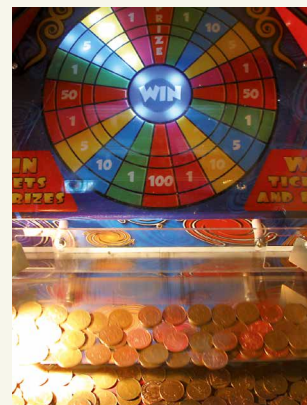
AUCH KLEINGELD SUMMIERT SICH

Männer nutzen viele Arten des Glücksspiels intensiver; lediglich zu Sofortlotterien und Gewinnsparen haben Frauen eine größere Affinität.